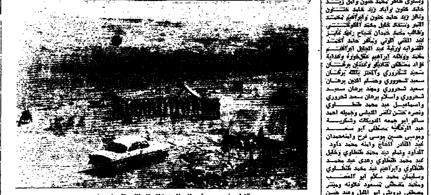
انتهاء مخيم مجموعة سلاح المين في الزرقاء الذي اقيم في جرش

عمان - يجرى الترتيبات اللازمة لاستقبال المطلوبين من الضفة الغربية الى نابلس في مبنى امانة لها صمتت غدا .